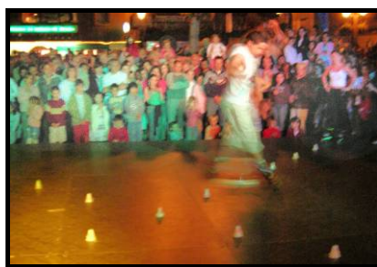
Un public de 1500 personnes